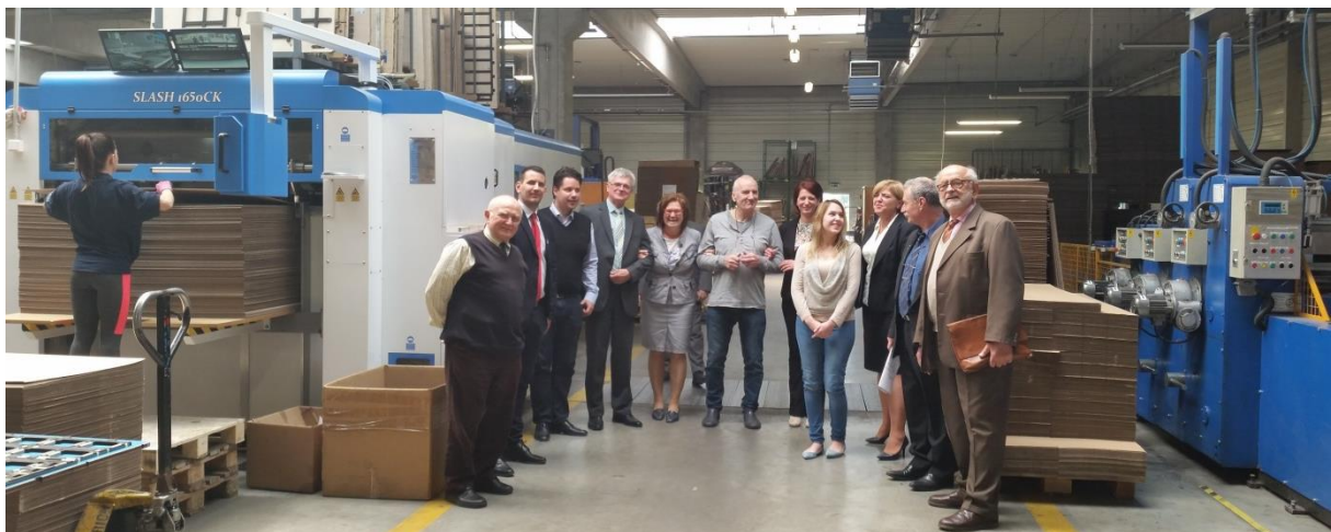
A Dunapack Mosonpack Kft.-nél tartott CSAOSZ KKV tagozati ülésen