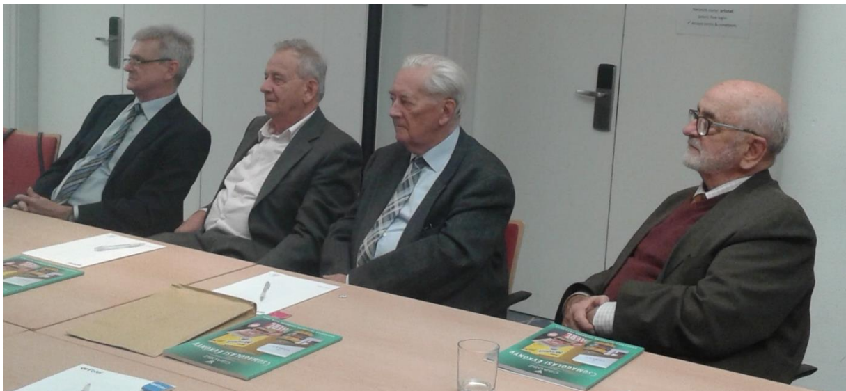
Az életműdíjjal kitüntetettek találkozásán 2018-ban