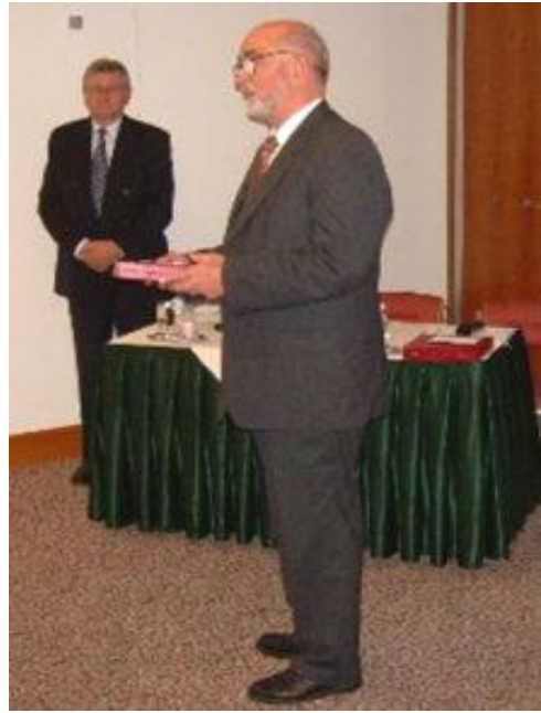
„A szakmáért” CSAOSZ életműdíj átadás alkalmával