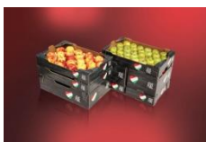
Rondo Hullámkartongyártó Kft.