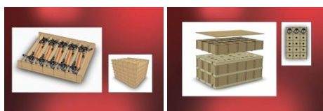
Green Packaging Kft.