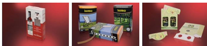
STI Petőfi Nyomda Kft.

Gratulálunk a nyerteseknek. Az ünnepélyes eredményhirdetésre 2020. május 8-án kerül sor az Interpack nemzetközi csomagolási kiállítás keretében Németországban, Düsseldorfban.