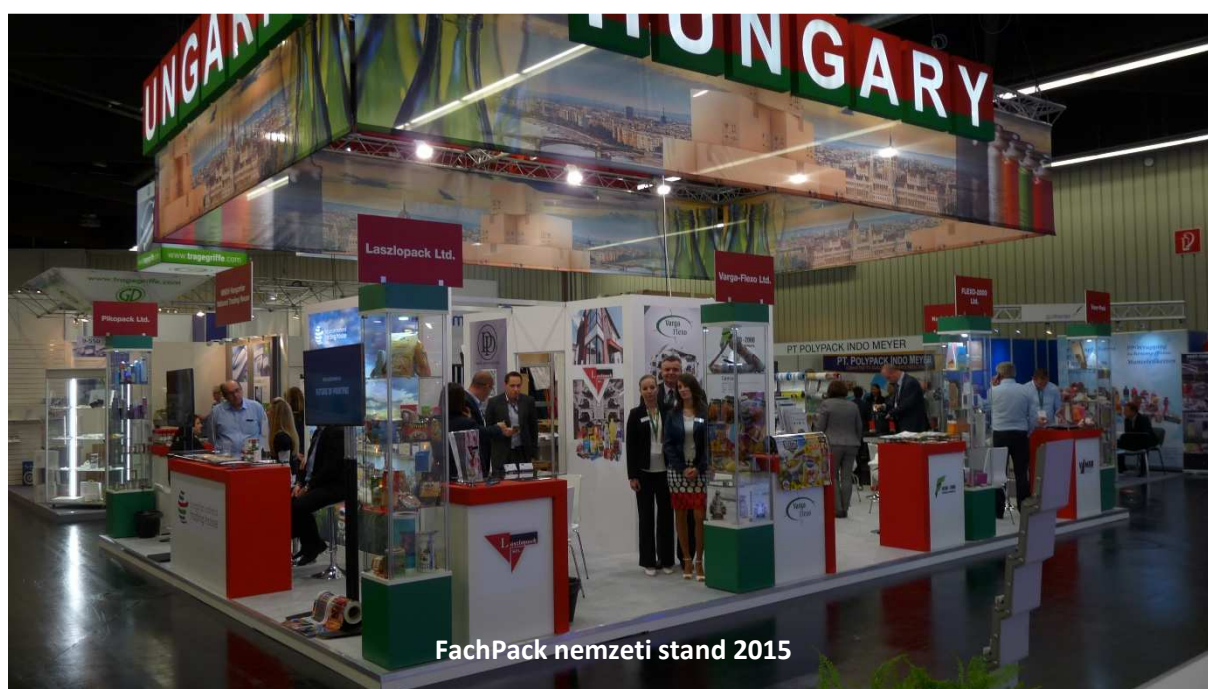
FachPack nemzeti stand 2015

Találkozunk Nürnbergben 2018. szeptember 25-27. között a FachPack-on!